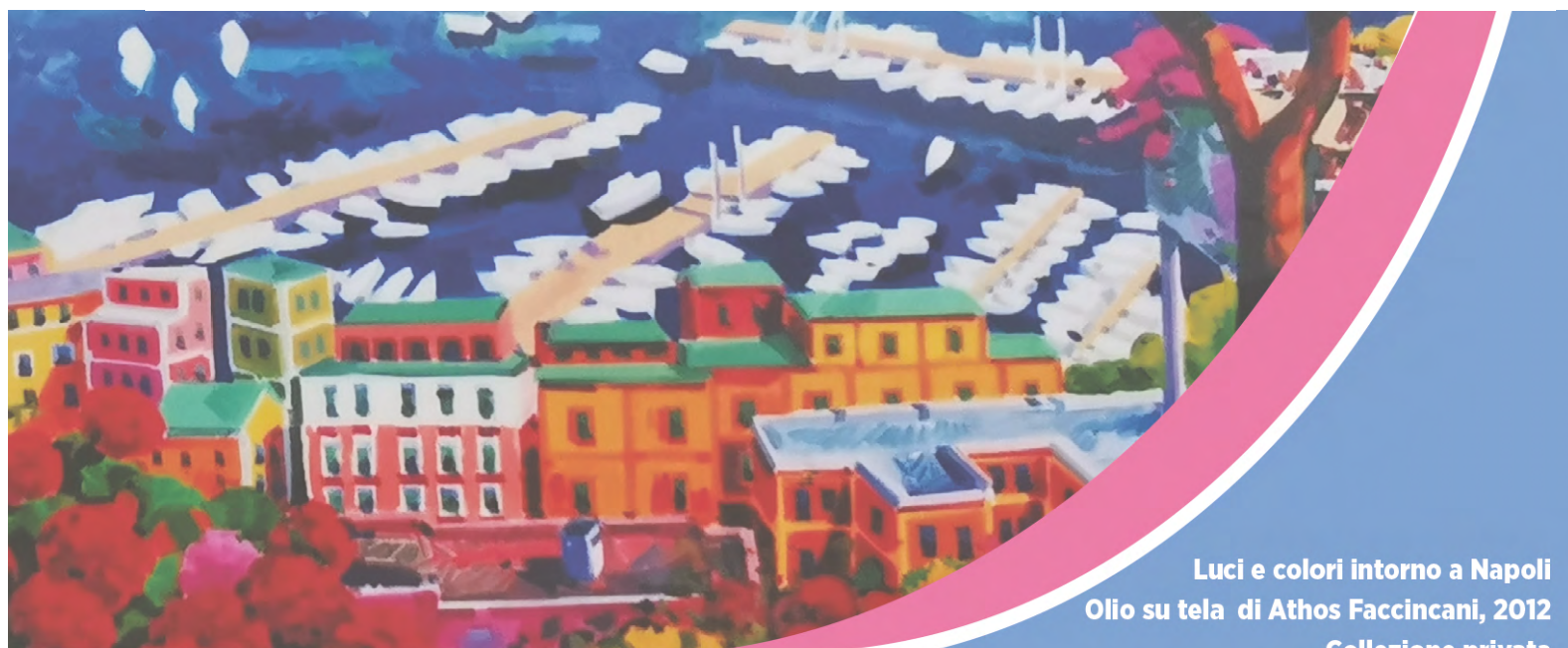
Luci e colori intorno a Napoli Olio su tela di Athos Faccincani, 2012 Collezione privata